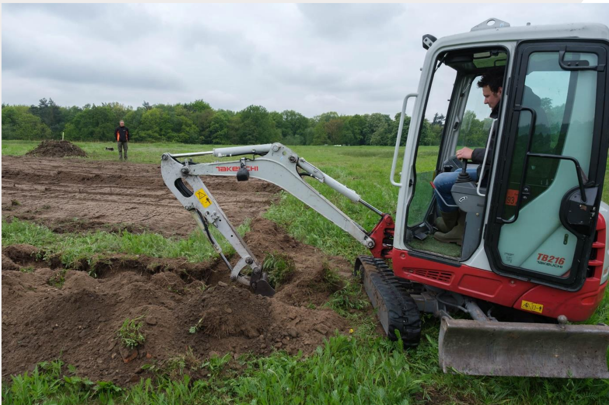
Figuur 3. Graven van sleuf aan de rand van proefvlak om folie in te bevestigen.