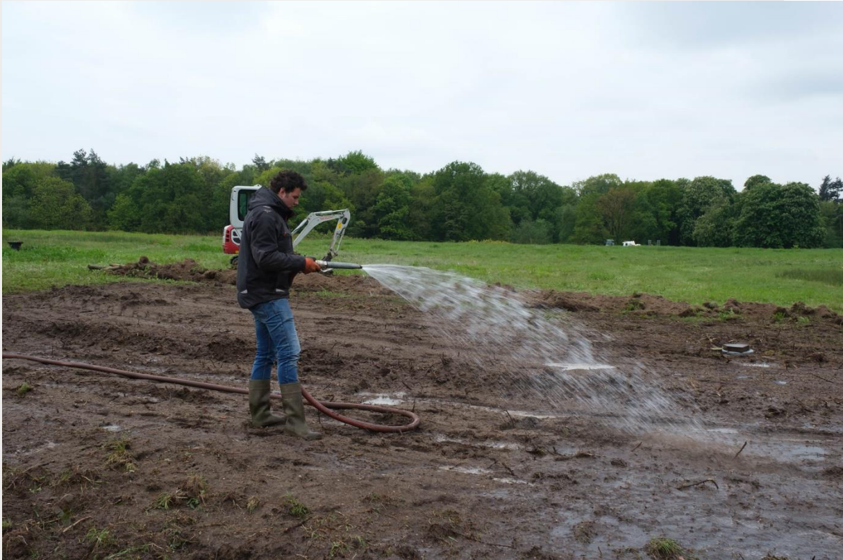
Figuur 6. Natmaken van de proefvlakken.