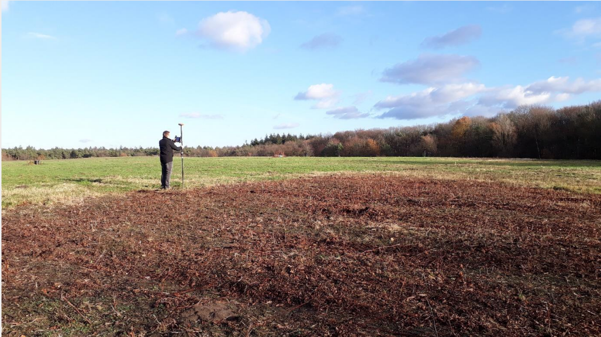
Figuur 2. Inmeten van de proeflocatie