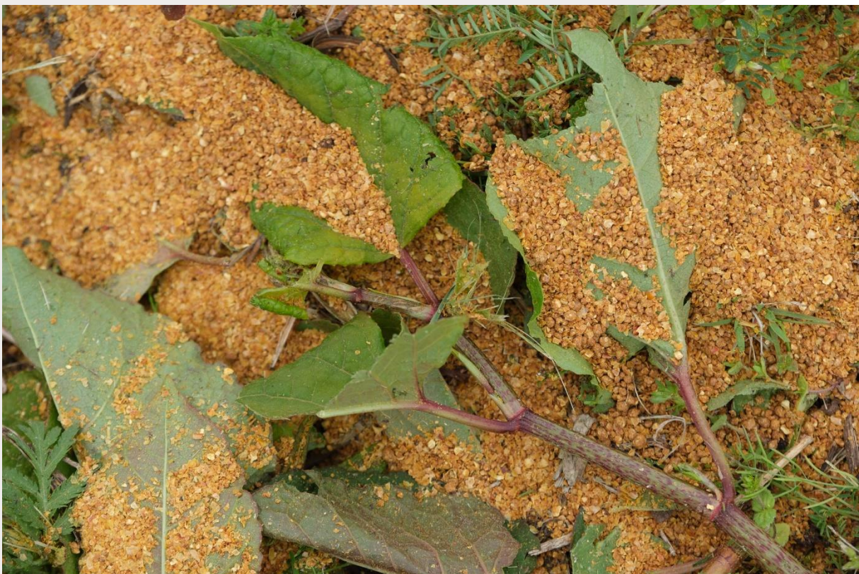
Figuur 5. Close-up van Herbie-korrels tussen de Aziatische duizendknoop.