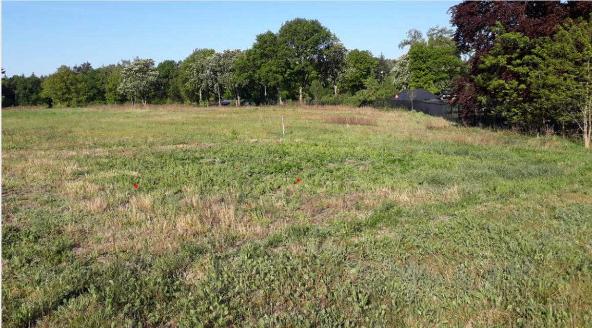
Figuur 12. De HEEM-vegetatie is op 30 september 2019 gezaaid en blijkt op 6 mei 2020 goed opgekomen.