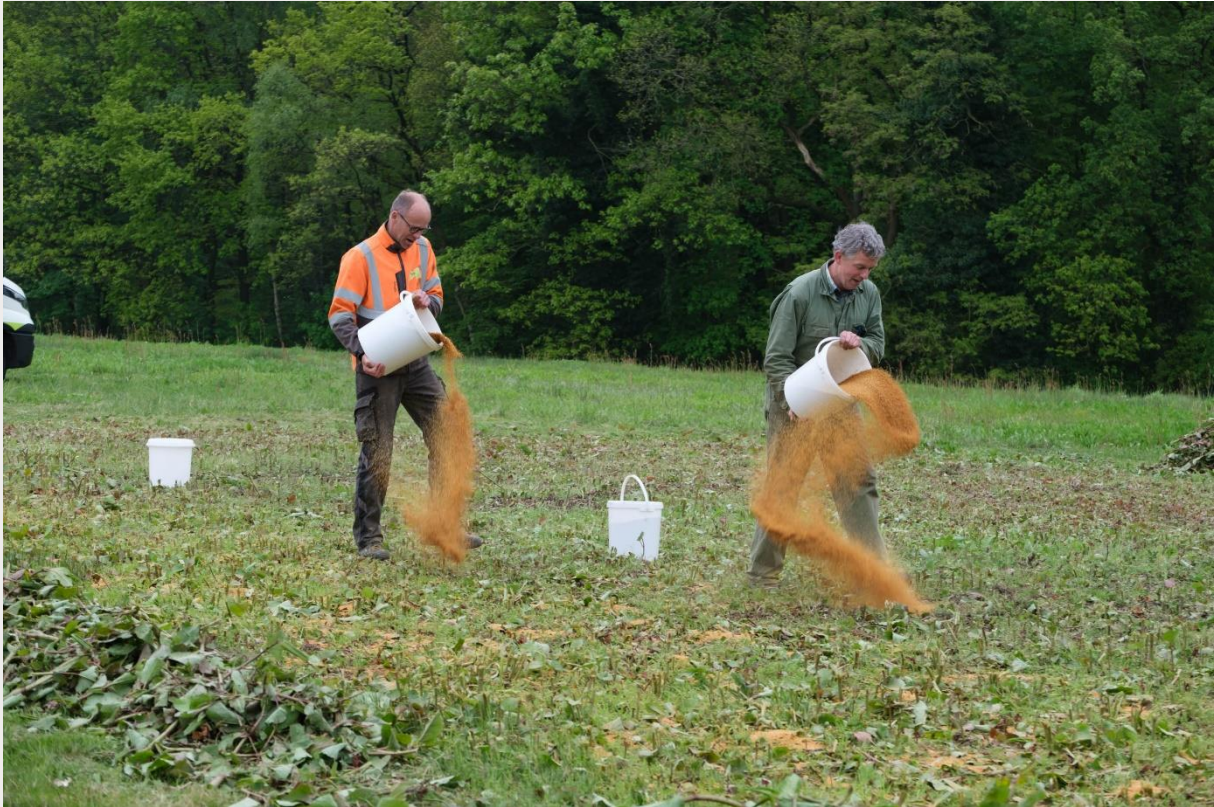
Figuur 4. Uitstrooien Herbie-korrels op proefvlak F.