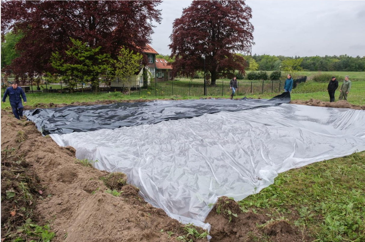
Figuur 8. Afdekken van het proefvlak met eerst een luchtdicht folie en vervolgens een landbouwfolie.