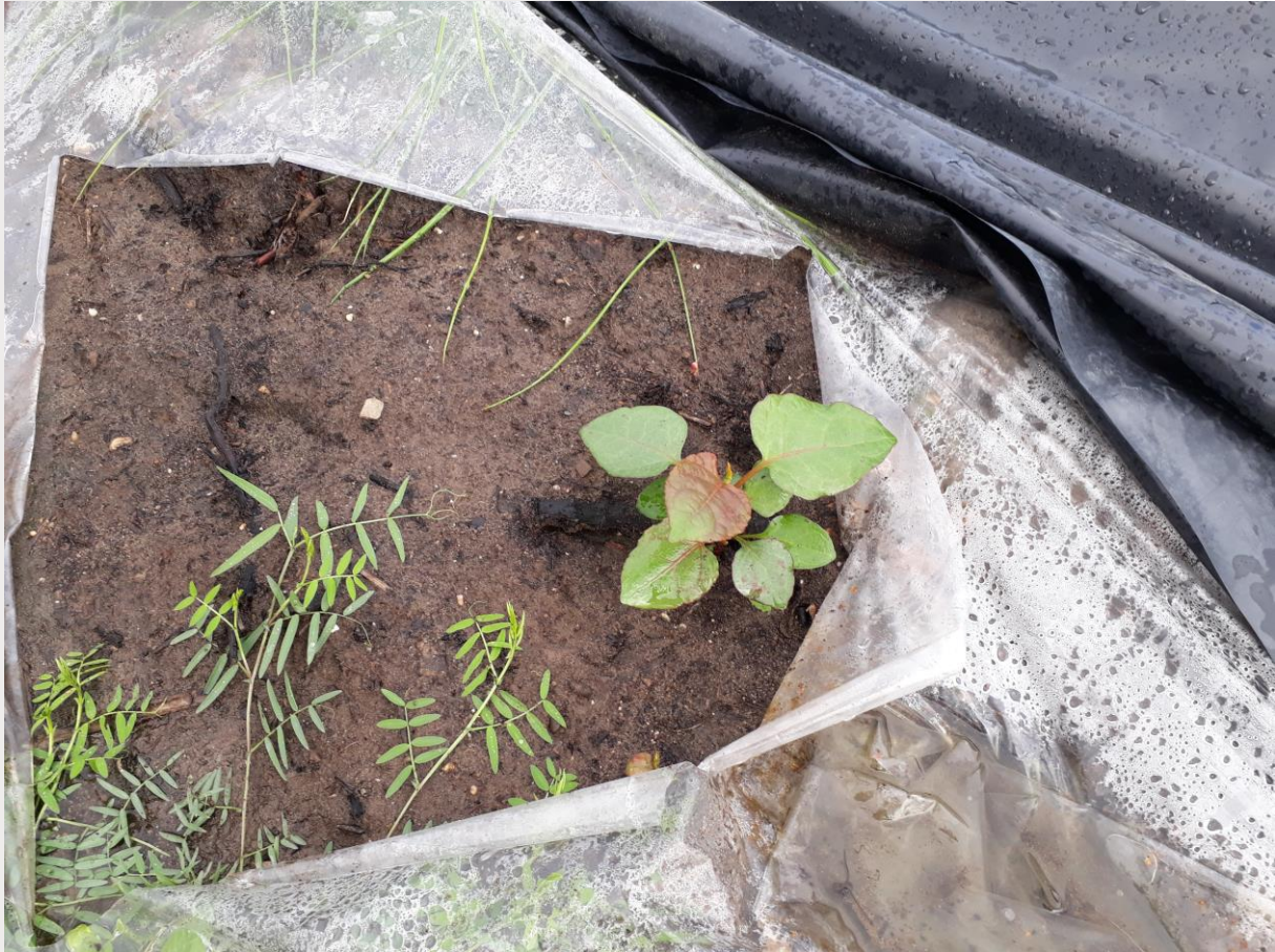
Figuur 11. In proefvlak F is op de locatie waar binnen twee maanden de folie gescheurd is de Aziatische duizendknoop weer opgekomen.