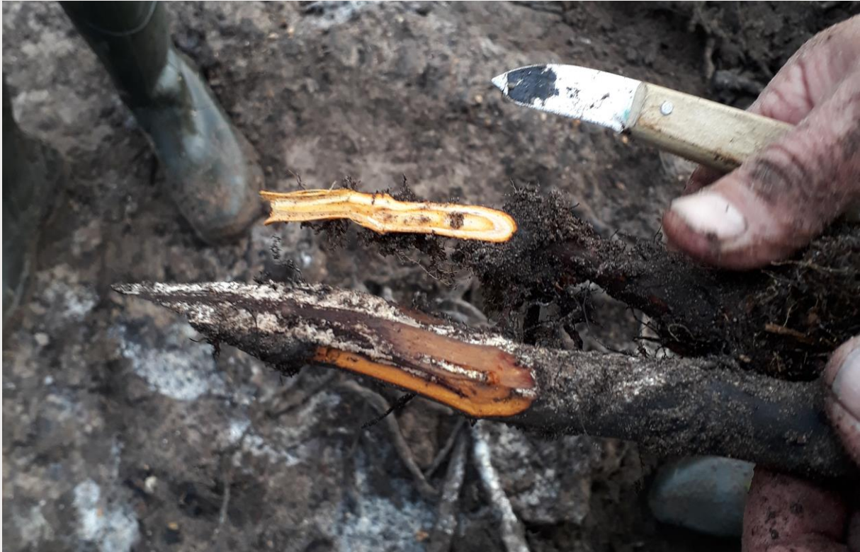
Figuur 10. Een van de afgestorven wortels in proefvlak A (beneden), en een levende wortel uit een referentievlak (boven).

In proefvlak D heeft geen analyse van het zuurstofgehalte plaatsgevonden. Omdat dit proefvlak op dezelfde wijze is behandeld als proefvlak A kan er van worden uitgegaan dat de bodem ook hier nagenoeg zuurstofloos is geworden. Het folie was bij het verwijderen op 30 september 2019 nog intact. Er heeft afsterven van Aziatische duizendknoop-wortels plaatsgevonden over het gehele proefvlak. Na verwijderen van het folie zijn geen levende restanten van Aziatische duizendknoop aangetroffen. Wel is aan de rand, net buiten het folie een plant aangetroffen. Mogelijk is dit een uitloper van een plant uit het proefvlak.