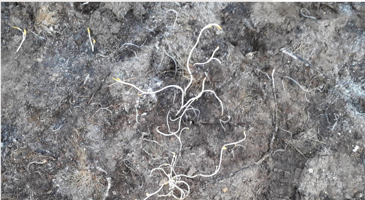
Figuur 9. Na het openen van proefvlak A waren hier witte wortels, waarschijnlijk van Aziatische duizendknoop aanwezig. Op 6 mei 2020 was er geen Aziatische duizendknoop meer aanwezig.

In proefvlak A is de bodem nagenoeg zuurstofloos geworden. Het folie was bij het verwijderen op 30 september 2019 nog intact. Er heeft afsterven van Aziatische duizendknoop plaatsgevonden over het gehele proefvlak. Direct na verwijderen van het folie zijn op zo'n 2 m 2 witte wortels gevonden aan een van de zijkanten van het proefvlak, waarschijnlijk van de Aziatische duizendknoop. Daarnaast zijn diverse afgestorven wortels aanwezig. Op 6 mei 2020 zijn op deze proeflocatie geen Aziatische duizendknopen vast gesteld. Blijkbaar waren de zichtbare wortels op 30 september 2019 niet meer levensvatbaar.