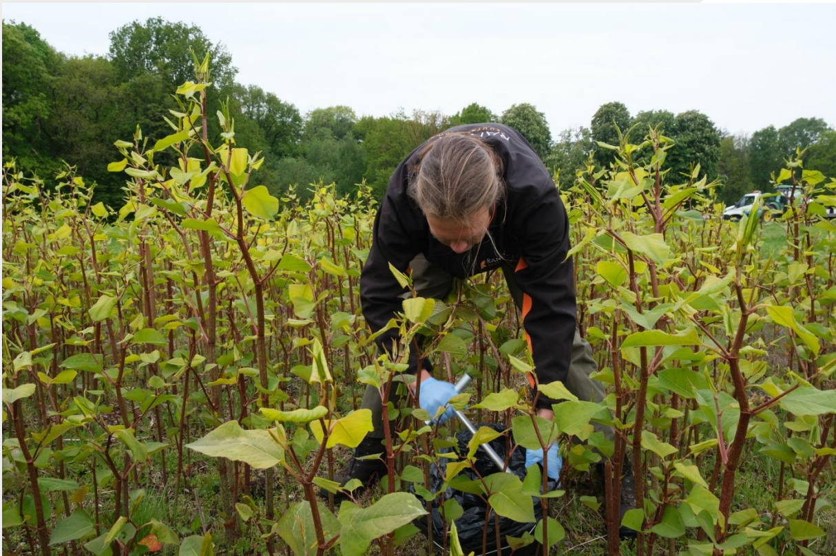
Figuur 7. Steken van bodemonsters ten behoeve van de DNA-analyse.